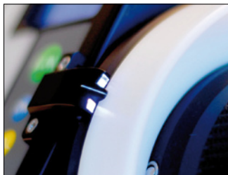
Illuminated index scale

The WCU-3 directly communicates with the ARRICAM Studio, ARRICAM Lite, ARRIFLEX 435 Xtreme, ARRIFLEX 416 Plus, and ARRIFLEX 416 Plus HS. In combination with the Universal Motor Controller UMC-3 or UMC-3A, it also works with numerous other still and video cameras. Power is provided by an affordable camcorder battery, such as the Sony Lithium M NP-FM 500H.